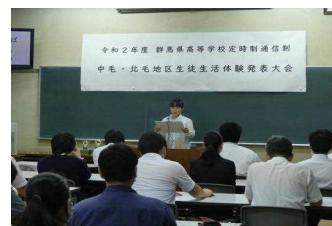
中北毛地区生徒生活体験発表大会の様子