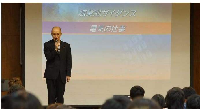
進路講演会の様子

機械・電気等の基礎技術を総合的に学び、将来の技術革新にも対応できる技術者の育成を目指しています。また進路講演会等も実施し、卒業後の進路を考える機会も用意しています。