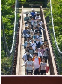
初夏のハイキング(5月)