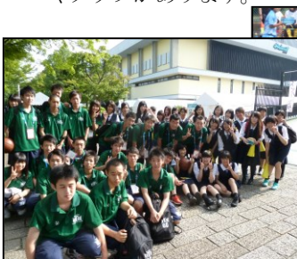
男子バスケはインターハイ出場