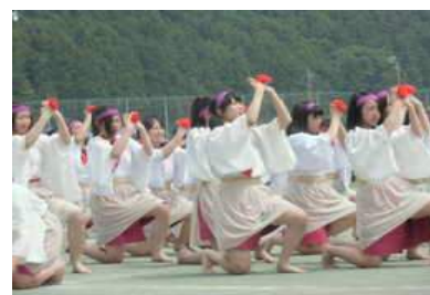
桜城祭 応援合戦の様子

「自主・自律」の精神が脈々と受け継がれています。様々な学校行事の多くは、生徒たち自身が企画し、運営します。大きな行事である「すずかけ祭（文化祭）」「桜城祭（体育祭）」なども、伝統を活かしながら、新たな観点も取り入れ、全校生徒が一丸となって完成させていきます。また、運動部・文化部ともに活発に行われており、毎年、関東大会や全国大会にも出場する部活動もあります。文化部では、全国でも珍しい高校オーケストラ（管弦楽部）などが腕を磨いています。