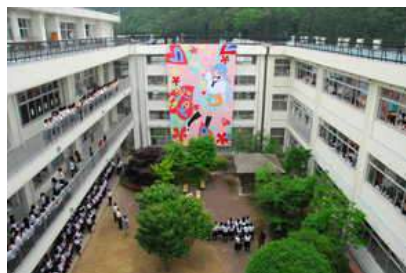
すずかけ祭 大垂れ幕