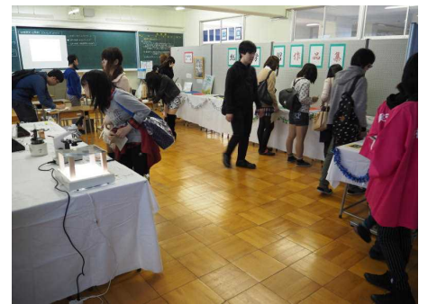
▲文化発表会通信制展示室（11月）