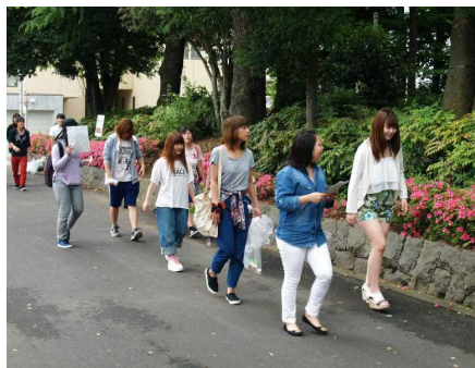
▲ウォークラリー（11月）