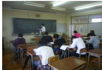
教室での授業の様子