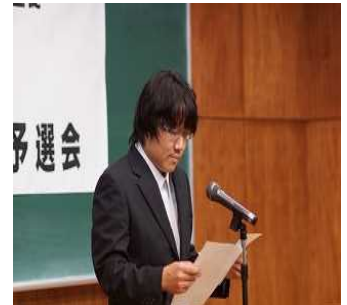
中北毛地区生徒生活体験発表大会の様子