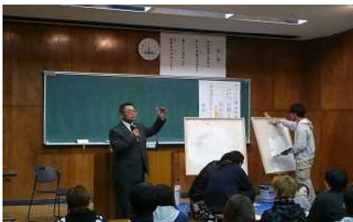
平成27年度キャリアアップ推進セミナーの様子

機械・電気等の基礎技術を総合的に学び、将来の技術革新にも対応できる技術者の育成を目指しています。また進路講演会等も実施し、卒業後の進路を考える機会も用意されています。