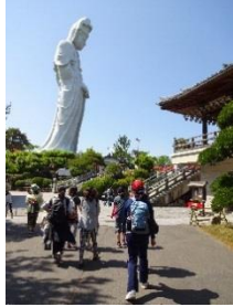
初夏のハイキング(5月)