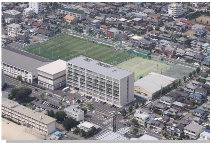
7階建ての新校舎と人工芝のグラウンド