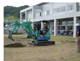
産業技術専門校での実技講習