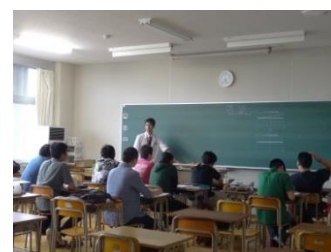
教室での授業風景

挨拶、礼儀を重んじ、健康で勤労を尊び進歩する時代に対応するために学習する生徒と社会常識を備えた生徒の育成を目指しています。