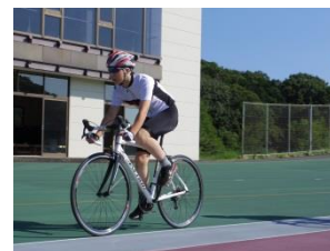
平成28年度自転車競技部全国大会出場