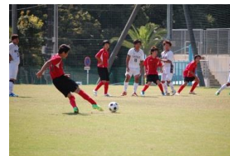
平成28年度サッカー部全国大会出場