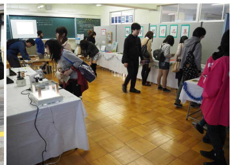
▲文化発表会通信制展示室（11月）