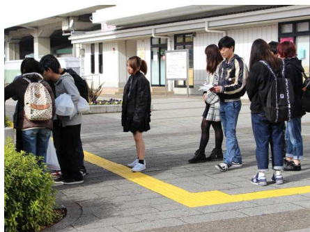
▲ウォークラリー（11月）