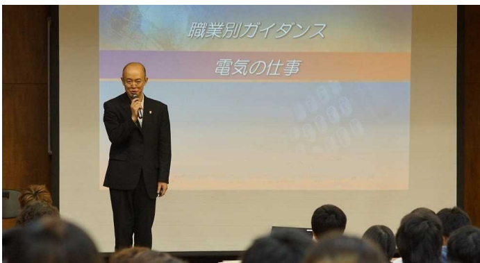
進路講演会の様子

機械・電気等の基礎技術を総合的に学び、将来の技術革新にも対応できる技術者の育成を目指しています。また進路講演会等も実施し、卒業後の進路を考える機会も用意しています。