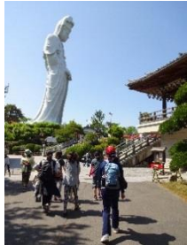
初夏のハイキング(5月)