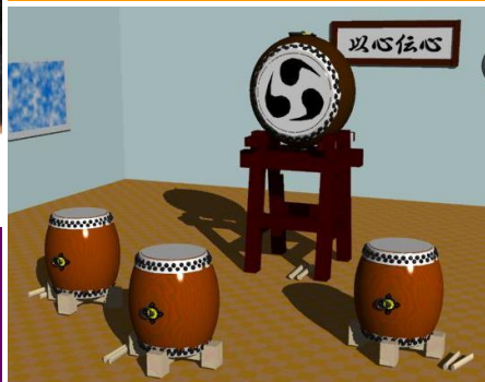
CGデザインコース「コンピュータグラフィックス」代表作品