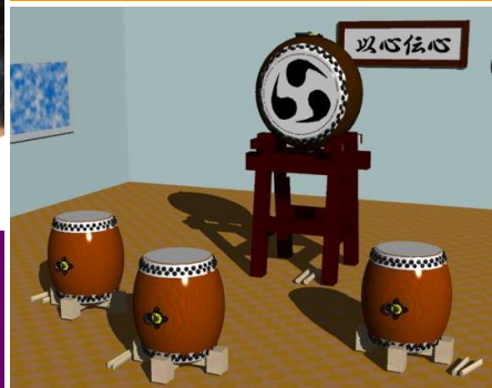
CGデザインコース「コンピュータグラフィックス」代表作品