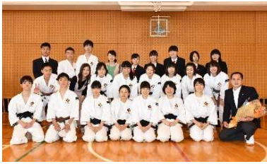
少林寺拳法部 全国大会出場