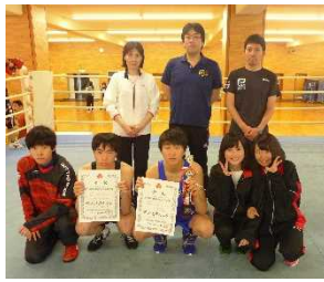
ボクシング部 全国大会出場