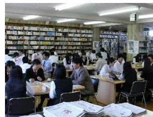
公開みらい学 (同窓生ら社会人を講師に招いた座談会)