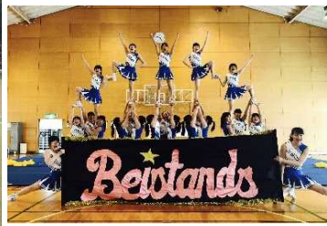
応援リーダー部 USA Nationals in Japan 2017 第3位