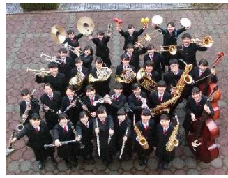
群馬学校吹奏楽新人戦 優秀賞 [太田高校と合同]