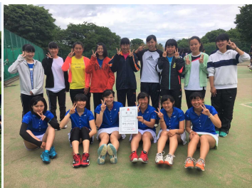
女子テニス部 団体 県総体第4位