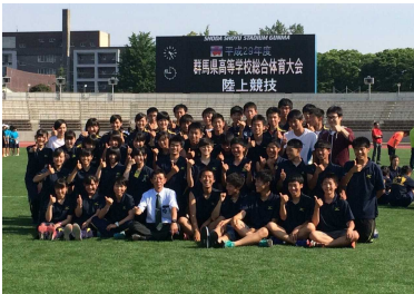
陸上部 関東大会出場