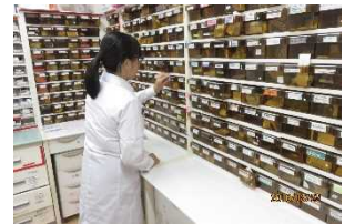
インターンシップ (普通科高校では先駆的な取組)

この Project を通して、校訓の示す「誠 (誠実) ・明 (明知) ・健 (健康)」を兼ね備えた、心身ともに健康で国際的視野を持つ、心豊かな人間を育成します。