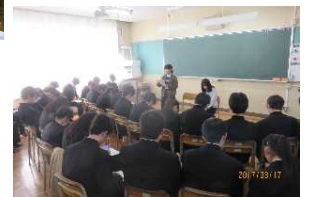
卒業生からのアドバイス (卒業生が受験体験談などを紹介)