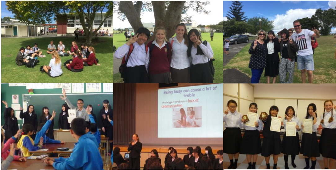
英語スピーチ発表会 海外語学研修（ニュージーランド）小学校訪問 英語弁論大会 等