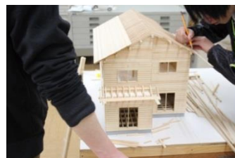
建築科の実習風景

(有)HIRO建築工房、富士工営(株)、厚木プラスチック(株)、蔵前産業(株) (株)新進、群馬トヨタ自動車(株)、(株)みまつ食品、(株)ちよだ