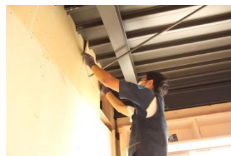
短期インターンシップ

夏休みには県立産業技術専門校で開かれる講座を受講し、CADの技術の習得や資格取得を目指しています。