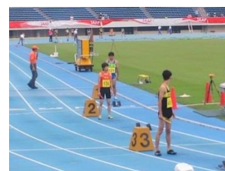
平成29年度陸上部全国大会出場