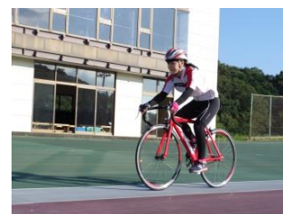
平成29年度自転車競技部全国大会出場

平成25年度・・・自転車競技部、サッカー部、陸上競技部、柔道部、卓球 (全国大会出場)