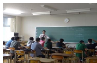
教室での授業風景