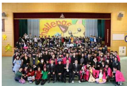
清陵文化発表会（11月）