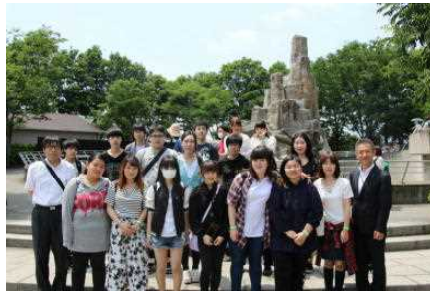
日帰り修学旅行（5月）