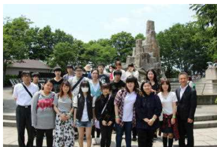
日帰り修学旅行（5月）