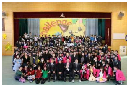
清陵文化発表会（11月）