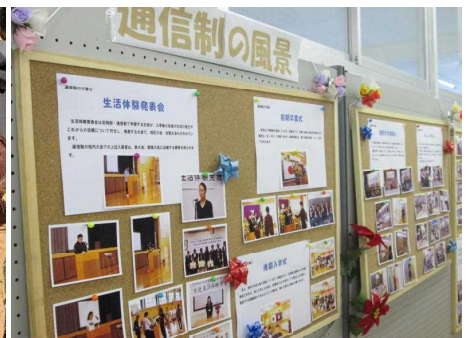
▲文化発表会通信制展示室（11月）