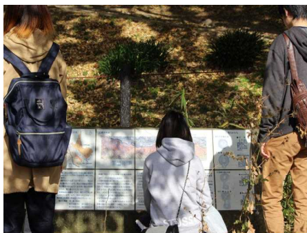
▲ウォークラリー（11月）