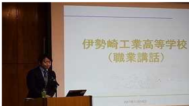
進路講演会の様子

機械・電気等の基礎技術を総合的に学び、将来の技術革新にも対応できる技術者の育成を目指しています。また進路講演会等も実施し、卒業後の進路を考える機会も用意しています。