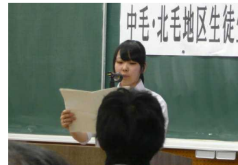
中北毛地区生徒生活体験発表大会の様子