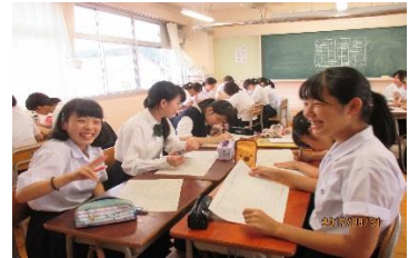
「総合的な学習の時間」の探究学習

また、渋女には特色のある行事がたくさんあります。開校記念行事である全校榛名登山をはじめ、清苑祭(文化祭)や体育大会、沖縄修学旅行など、どの行事にも生徒が主体的に取り組んでいます。