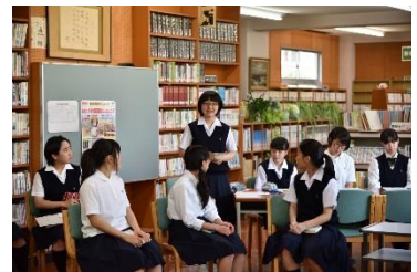
図書室でのビブリオバトル