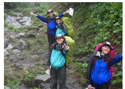
インターハイで活躍した山岳部