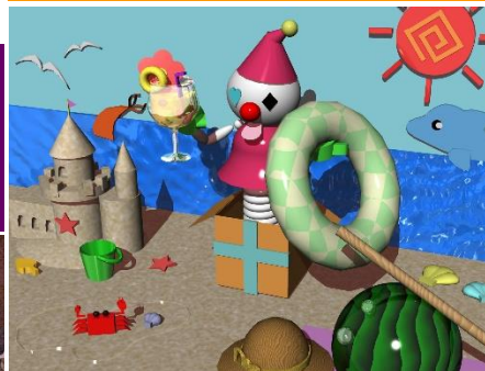
CGデザインコース タイトル「サマータイム」 H29 足利工業大学CGコンテスト優秀賞受賞作品