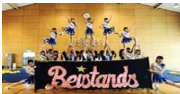
応援リーダー部 全国大会出場