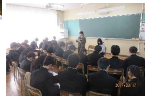
卒業生からのアドバイス (卒業生が受験体験談などを紹介)