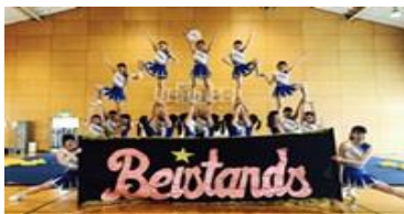
応援リーダー部 全国大会出場