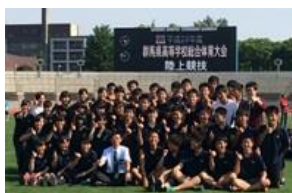
陸上部 関東大会出場