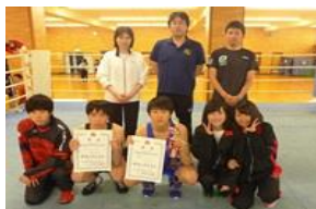
ボクシング部 全国大会出場 インターハイ5位