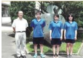
水泳同好会 関東大会出場