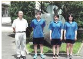
水泳同好会 関東大会出場