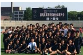
陸上部 関東大会出場