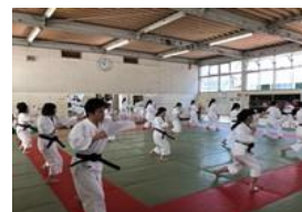
少林寺拳法部 全国大会出場