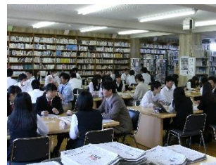
公開みらい学 (同窓生ら社会人を講師に招いた座談会)