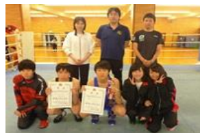
ボクシング部 全国大会出場 インターハイ5位