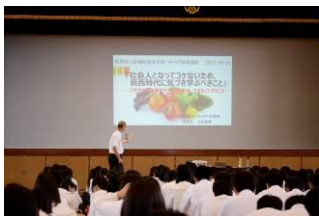
キャリア教育講座

土曜課外授業、早朝課外授業、夏季学習合宿、各種面談、校外模試、大学等出張授業、大学等見学、進路講演会など充実したキャリア指導を行っています。