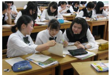
協力して問題解決する授業の様子

また、渋女には特色のある行事がたくさんあります。開校記念行事である全校榛名登山をはじめ、清苑祭(文化祭・隔年実施)や体育大会、沖縄修学旅行など、どの行事にも生徒が主体的に取り組んでいます。