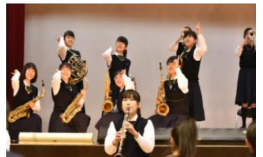
新入生を歓迎する吹奏楽部