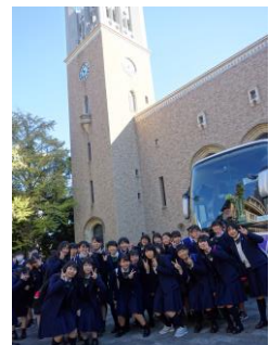
早稲田大学を見学する1年生