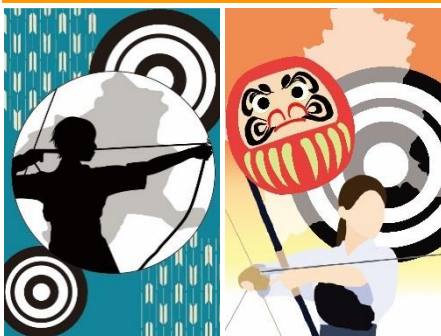
CGデザインコース 東日本高等学校弓道大会ポスターコンクール入賞作品