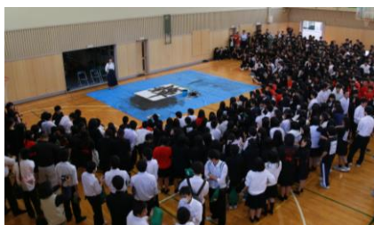
開会式での書道パフォーマンス