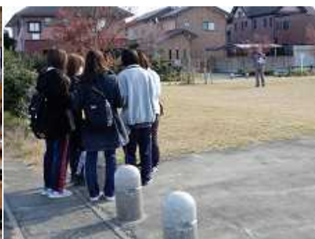
▲ウォークラリー（11月）