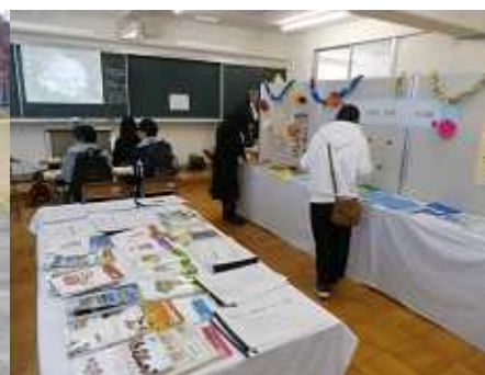
▲文化発表会通信制展示室（11月）