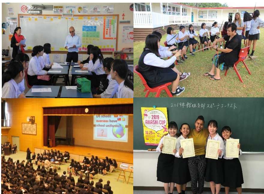
英語スピーチ発表会 海外語学研修（ニュージーランド）英語弁論大会 等