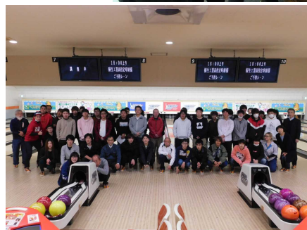
校内親善競技大会