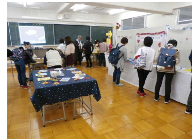
文化発表会通信制展示室（11月）