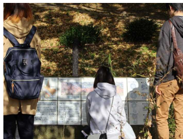
ウォークラリー（11月）