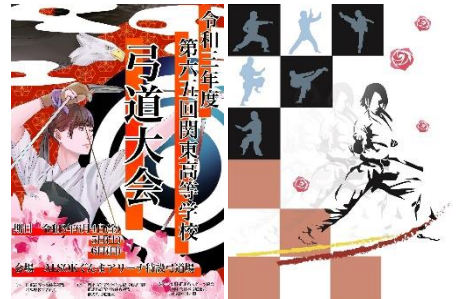
CGコース 全国・関東大会プログラムデザイン入選作品